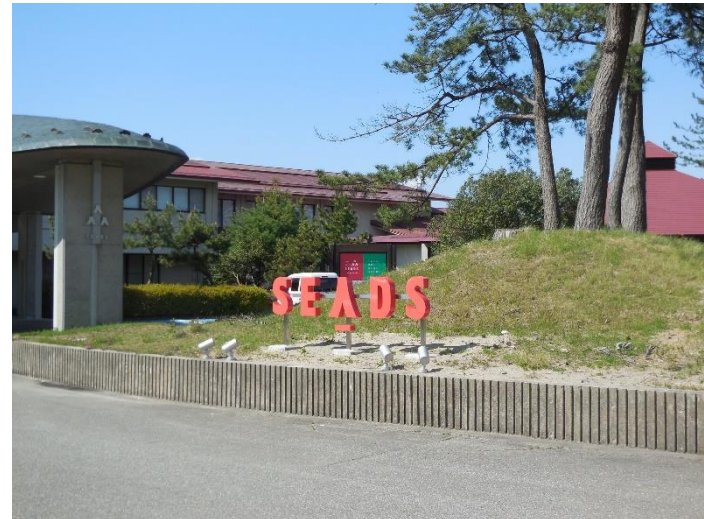
農業研修施設に生まれ変わる