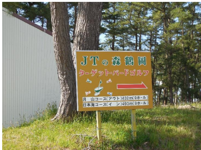
ターゲット・バードゴルフ場案内板